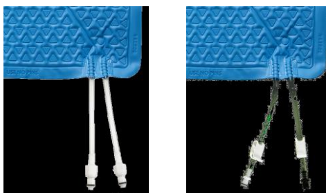
Önzáró csatlakozó Cspeszkes csatlakozó